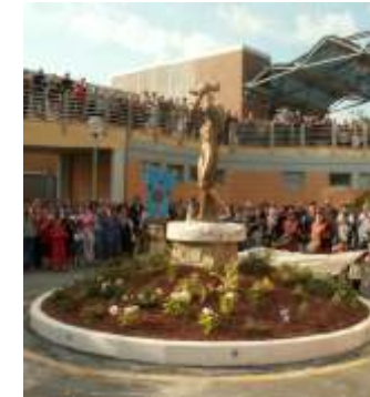
"Santa Margherita da Cortona" Nuovo Ospedale della Valdichiana Cortona (AR)