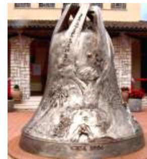
"Campana della Fratellanza" Chiesa di Cesa