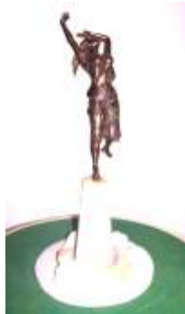
Monumento alle vittime civili della guerra - Arezzo