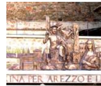
"Omaggio alla nostra storia" Emiciclo Giovanni Paolo II Scale mobili di Arezzo