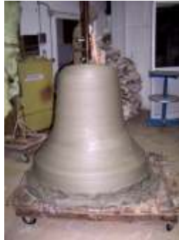
Campana della Creatività Parco della Creatività