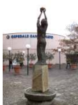
"Monumento a San Donato" Ospedale di Arezzo