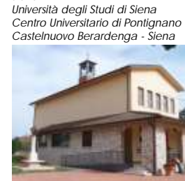
"Attimi di Paradiso" Chiesa dei Santi Michele Arcangelo e Lucia - Cesa Marciano della Chiana - Arezzo