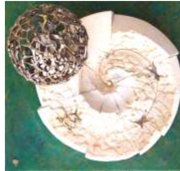
Monumento ai caduti sul lavoro Parco Pertini - Arezzo