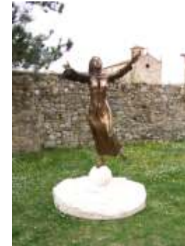
"Monumento a Santa Caterina da Siena"