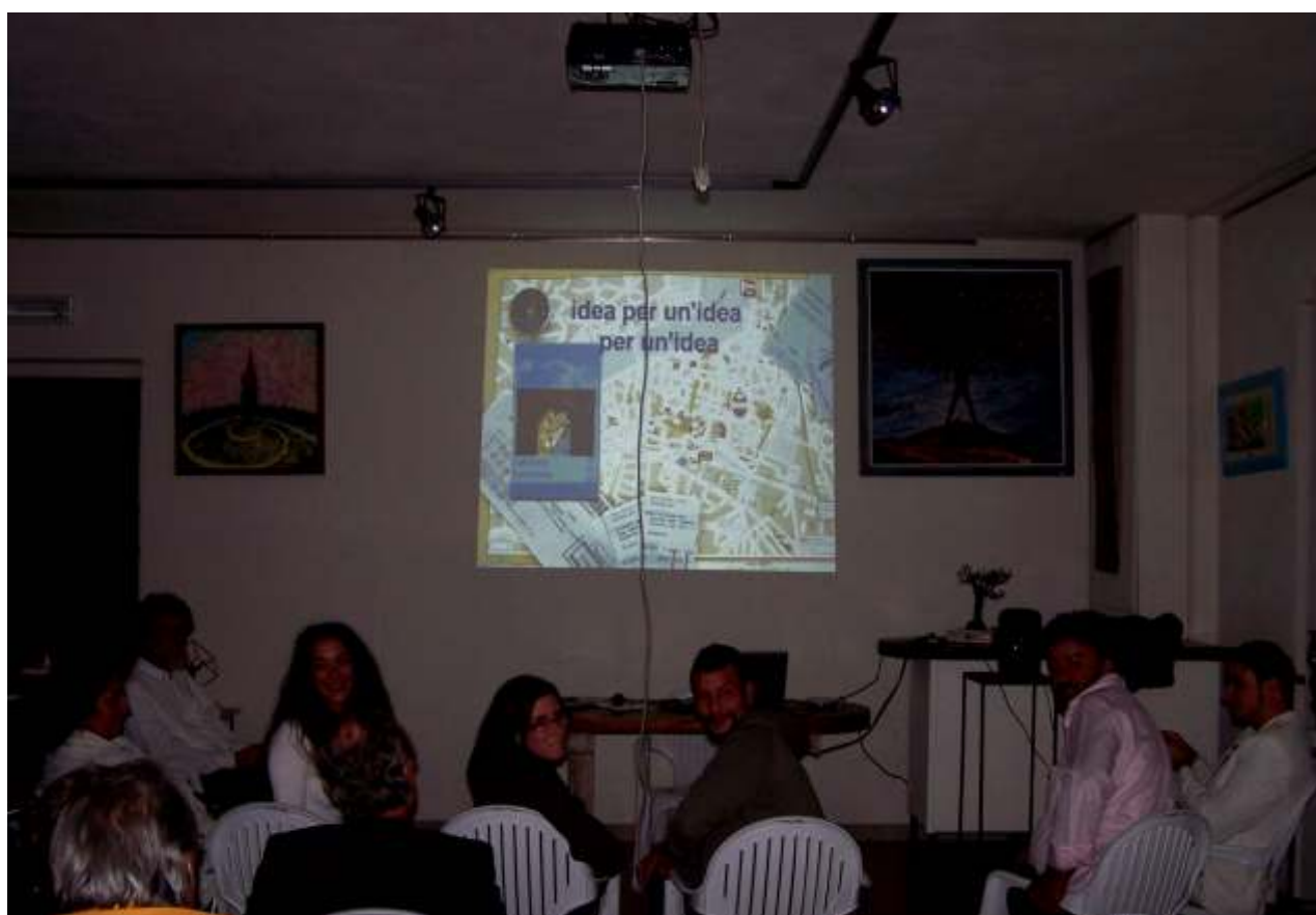
Proiezione del fumetto "Idea per un'idea per un'idea" di Simone Savarese