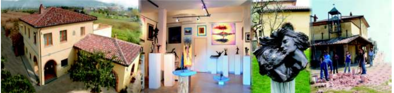
Monumento a Roberto Benigni