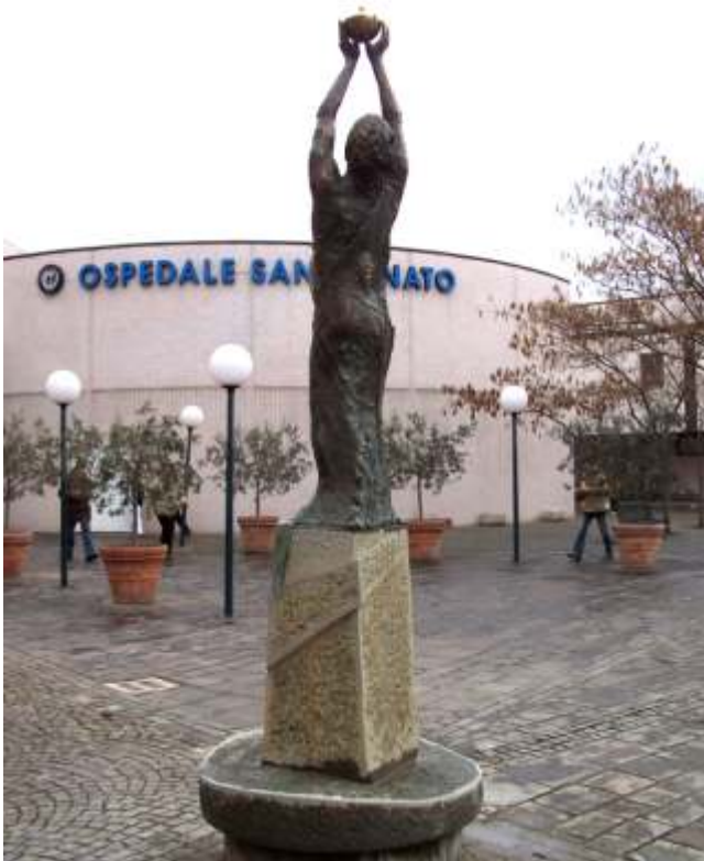
Monumento a San Donato - Ospedale di Arezzo