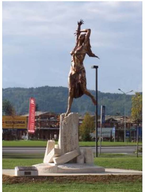
Monumento alle vittime civili di guerra Arezzo