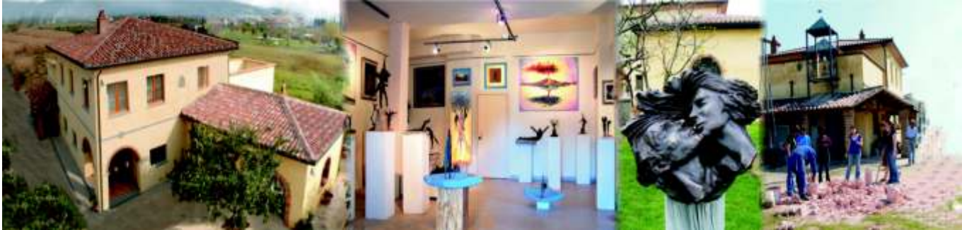
Monumento a Roberto Benigni