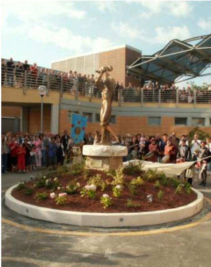
"Santa Margherita da Cortona" Nuovo Ospedale della Valdichiana Cortona (AR)