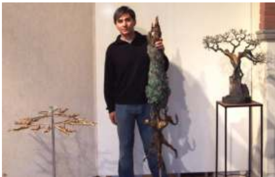
"Solidarietà", "Toscani" e "In memory of Marco Polo in China" Gordon Butt Collection - Hong Kong