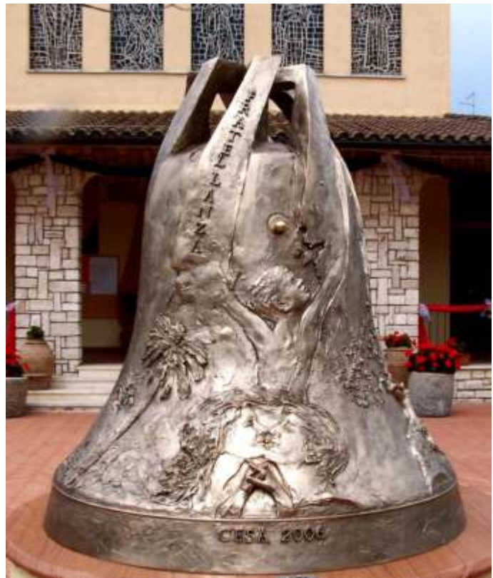
Campana della Fratellanza Chiesa dei Santi Michele Arcangelo e Lucia - Cesa