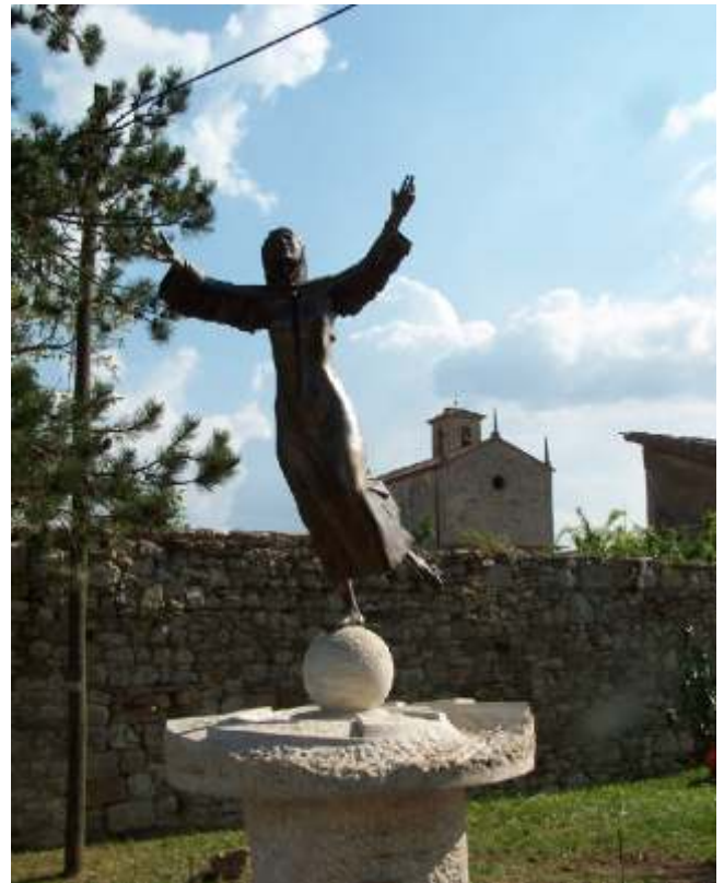
Monumento a Santa Caterina da Siena Università degli Studi di Siena Centro Universitario di Pontignano Castelnuovo Berardenga - Siena