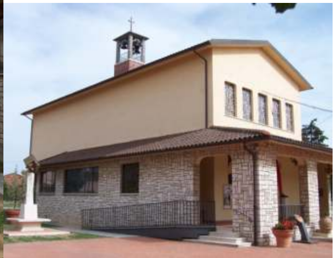
"Attimi di Paradiso" Chiesa dei Santi Michele Arcangelo e Lucia Cesa Marciano della Chiana - Arezzo