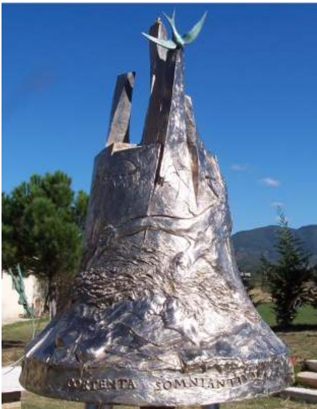
Campana della Creatività Parco della Creatività - Manciano - AR