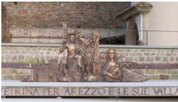
"Omaggio alla nostra storia" Emiciclo Giovanni Paolo II Scale mobili di Arezzo